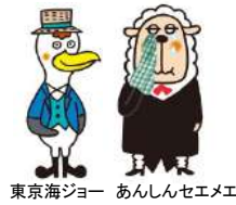
東京海ジョー あんしんセエメエ

総合滋賀の「S」と琵琶湖をイメージし、その周りを弊社経営理念である「三方よし」からお客様・社員・地域が手をつなぎ発展していくことを意味しています。また色については「地球環境を守りたい」という願いから、湖・海、青、大地の緑、太陽の赤にしております。お客様に何が出来るかを常に考え、ロゴマークが意味することを社員一同心に刻み、日々研鑽したいと思っております。