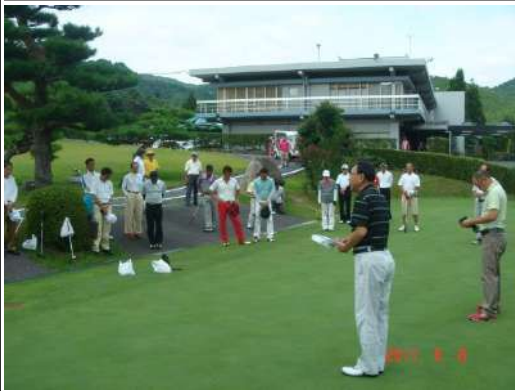
開会式で挨拶する弊社会長(OUTスタート付近にて)

今年も8月8日、真夏の炎天下のもと「第21回TOKIOMARINENICHIDO足立杯」を甲賀カントリークラブにて開催いたしました。参加者総勢54名と今年も多くの皆様に「ご参加いただきました。当日は、8月ということもあり暑くなるものが予測されましたが、思ったよりも気温は上がりず絶好のゴルフ日和となりました。 8時30分に開会式を行い、OUT・INそれぞれに別れていただきいぎスタート。それぞれ特徴のある(笑)スウィングでドライバーショットを放っていたいただきました。日頃は、仕事に追われている皆様方ですが、この日ばかりは仕事のことを少し忘れ、良い汗を流しておられました。